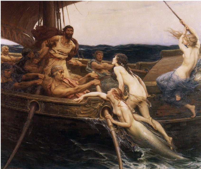
Ulysse et les sirènes Herbert Draper